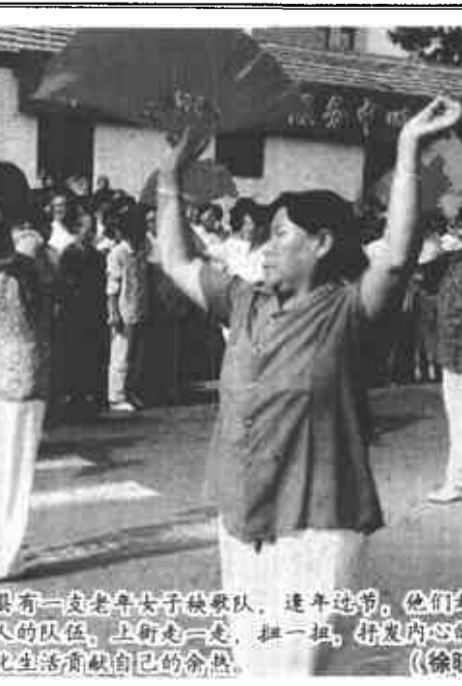
广饶县有一支老年女子秧歌队，逢年过节，他们都要踏着欢快的节奏，汇入青春人的队伍，上街走一走，扭一扭，抒发内心的喜悦和幸福，也为丰富群众文化生活贡献自己的余热。